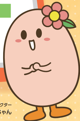
生活クラブ共済 ハグくみキャラクター ハグみちゃん

ヒントを参考に、生活クラブの共済にちなんだ 簡単なクイズ2問に答えて消費材をもらおう!