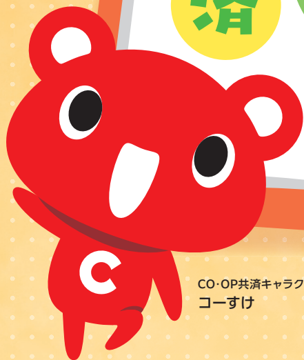
CO-OP共済キャラクター コーすけ