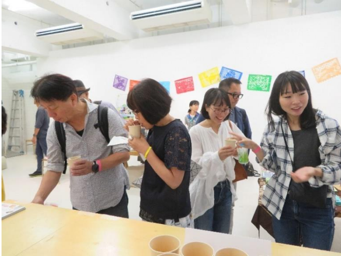
タラーメンの試食は大好評でした。

また、タラーメンの試食と、生活クラブのみかんジュースとコーヒー、お茶の試飲を行いました。タラーメンの試食は大好評で、とても美味しいという声を頂き、販売もあっという間に完売となりました。