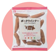
ソーセージ・ハム