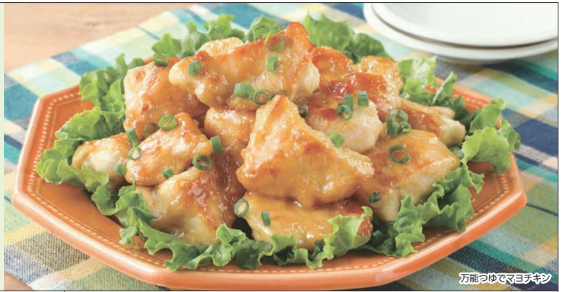
万能つゆでまよひチキン

「丹精國鶏」は3世代にわたり日本生まれ・日本育ちの国産鶏種です。自然の光や風が入る開放型鶏舎で、55日以上かけてじっくり育てるため弾力があり旨みの詰まった肉質になります。