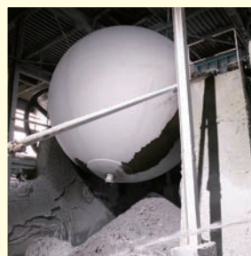
ロールペーパーの原料は古紙。古紙を「地球釜」と呼ばれる釜の中でほぐしてから使います。

近年の日本では、台風や地震に加え、集中豪雨などの災害も多発するようになってきました。予約を行ない、常日頃から家庭内で回転備蓄しておくことは、命を守る行動にもつながると私たちは考えています。