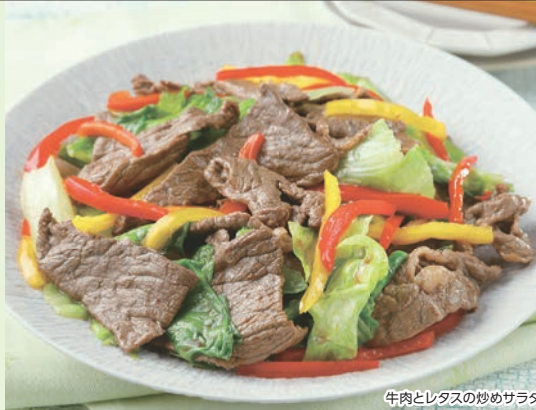
牛肉とレタスの炒めサラダ

北海道産の良質な赤身牛肉です。飼育から加工まで北海道チクレンが一貫して生産管理しています。牛の健康を考え、飼料には牧草を中心に、遺伝子組み換えでないトウモロコシなどを配合して与えています。