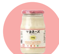
調味料・調理素材