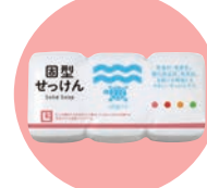
せっけん類・日用品