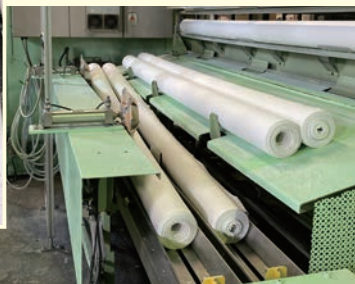
できた紙を100メートルずつ巻き、さらに使いやすい幅に裁断して、ロールペーパーを作ります。