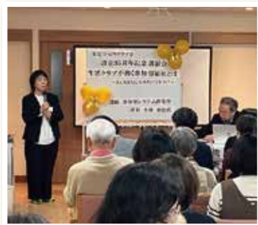
「元氣な暮らしのヒント」地域に 役立つ企画も開催しています