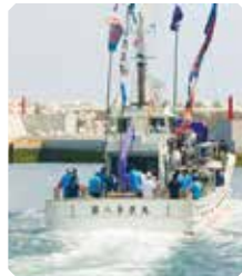
定置網船「第八与奈丸」 東日本大震災で船外機付小型漁船814隻のうち800隻を失い、20隻あった定置網船は10隻に減ってしまいました。その復興を願い、組合員のカンパで3隻が建造されました。