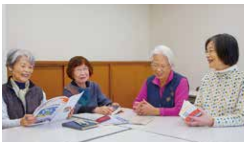
読書会をきっかけに、毎回会話が広がっていきます

地域に声をかけ合える関係があると、暮らしにちよつと安心感が生まれます。生活クラブでは、県内を5つのエリアに分けて多様な活動を展開中です。その中から、組合員によるゆるやかなつながりを育む活動を3つ紹介します。