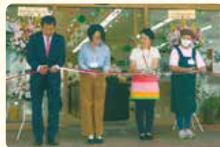
新しい門出を祝う テープカット

※リニューアルの実施は、一定数の組合員が該当デポーに加入していることが条件になります。