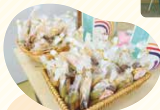
あふるまいの クッキー