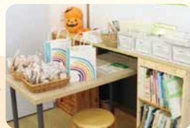
組合員コーナーや 掲示スペースも リニューアル