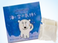
コンディショナーバー 海と空の気持ち

市場のシャンプーのほとんどが液体の中、固形化したことで輸送によるCO 2 削減にも大きく貢献しています。外箱には「あなたに届くお水を地球にやさしさ」と書かれ、中袋は「紙製のこだわり。脱プラにもつながる環境に配慮された固形せっけんです。」