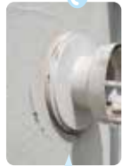
屋外換気口の 根元から雨漏りが 発生していたケース

住まいを長く維持するためには、雨漏り対策は最優先です。住宅に雨水が浸入し続けると、建物の構造までが傷み、のちのち大掛かりな補修が必要になる恐れがあります。雨漏りの原因を調べる方法として、2名体制で水かけ調査を行い、原因箇所を突き止めるやり方があります。費用は調査の範囲や難しさにもよりますが、税込み3.3万円～ 6.6万円くらいです。原因が特定できれば、それを止めるための対策も立てられます。ぜひ、ご相談ください