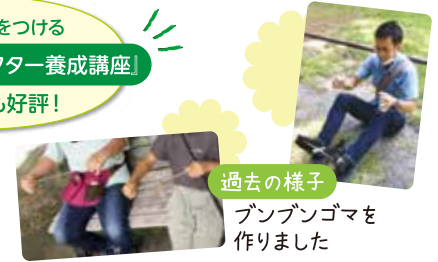
過去の様子 ブンブンゴマを作りました