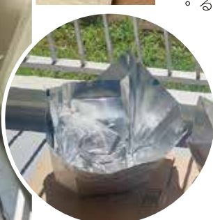
太陽の熱を利用して調理するソーラーフッキング