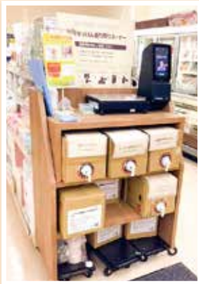
つなしまデポの量り売りコーナー

量り売りせっけんは、プラスチック容器削減で少しお得な価格で買えるのも魅力のひとつ。2022年の実験取り組みから開始したつなしまデポの量り売りコーナーでは現在、自宅から持ち込んだ容器に手慣れた様子で注ぐ組合員も見かけられます。自らの「ユース容器に注ぐ」作業が、興味関心のある組合員の目に留まり、使う人が広がっています。