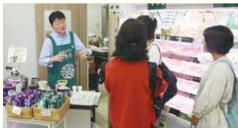
日東珈琲の 試飲販売