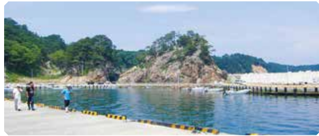
東日本大震災の時、重茂半島に押し寄せた津波は泥を巻き上げることなく「青色」でした。これは、海底まできれいな環境が守られてきた証です。

岩手県の最東端・宮古市にある「重茂漁協」はわかめなどの生産者であり、地元の海の汚染はまさに死活問題です。こうした背景から、重茂漁協は1976年には合成洗剤を「売らない・買わない・使わない」という「3ない運動」をスタートさせました。さらに1980年には合成洗剤の使用を全面的に禁止し、豊かな海と天然資源を守るための看板を今も掲げ続けています。