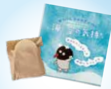
せっけんシャンプー 海と空の気持ち

日々欠かせない洗剤の中で、何を選ぶかが地球環境の未来を左右します。水は地球からの借り物。川や海などの環境を保つためには、自然に負荷の少ないせっけんを意識的に広めることが大切。せっけんを購入し、未来の地球にできることを考えるきっかけにしてください。