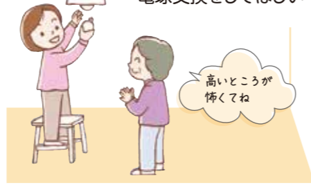
高いところが 怖くてね