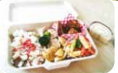
クリスマス会で食べた消費材を使ったお弁当