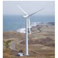
生活クラブ風車「夢風」

引っ越しを機に、生活クラブなら安心 かなと利用を始めました。食べものと 同じように、安心できるでんきまでつ くる生活クラブってすごいなと思いま す。生産者さんに会う機会 もいただき、日々の活動か ら気づきを得て、今では身 近な消費材です。