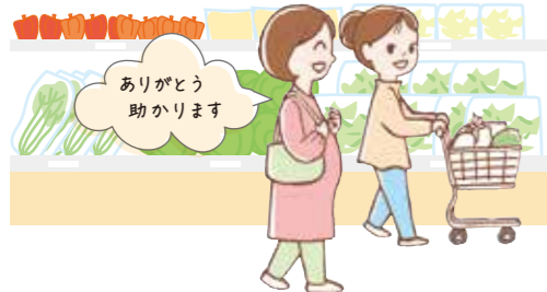
ありがとうございます 助かります