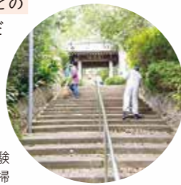
ボランティア体験 お寺清掃