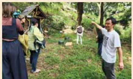
現地((一社)ミライエ)での講座の様子

持続可能な地域づくりをめざす NPO法人全員参加による地域未来創造機構(略称:未来機構)