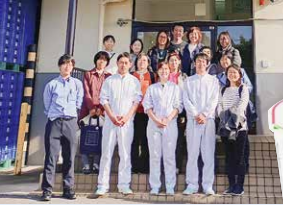
新生酪農にて 生産者のみなさんと