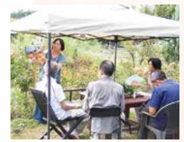
ハーブ畑で読み聞かせ