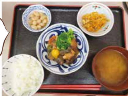
生活クラブの消費材を使った自慢のごはん

7年も赤字つて、企業だったら閉じるかもしれない。でも生活クラブとW.Coは組合員がつくってきた参加型福祉の価値をとっても大事に思っていて、そうはしなかった。これは生活クラブ50年の歴史の重みだと思えます。 橋本は地域の大事な資源です。それを広げたいことが、さがみ生活クラブの使命だと思っています。参加型福祉を地域に広げることをめざしてW.Coで働くのでもいいし、居場所づくりをしてもいい。地域課題を解決する市民活動を含めてさまざまな選択肢があって、自分たち組合員が自分たちのできることを見出すことができれば、福祉に関わる人も増えてくると思います。