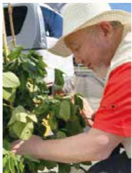
枝豆の収穫 デイサービスの園芸作業

私たちはそんな変だなと思うことに着目して、行政への政策提案もできる。それがほかの事業者と違う、生活クラブ運動グループという運動体の中にいるからこそその力だと思っています。