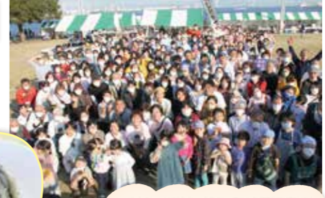
参加者の笑顔満開!