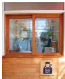
若手メンバー中心に進めた リニューアル

信頼されて仕事を任されて意見が反映されると嬉しく、ここで働くなら受け身でも構わないと感じるようになりたい。 このお店が大好きで続けてほしいので、そのために何かできるか、新しい方にメンバーになってよかったと言ってもらえる職場づくりをしたいです。