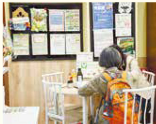
組合員がデザインした 休憩スペース