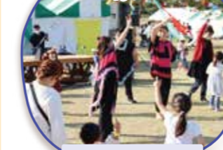
大人も子どもも踊る!