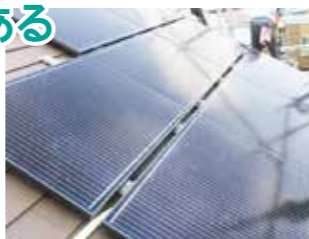
太陽光発電設置工事(戸塚区I邸)

気候変動の影響が、世界中で激しく現れています。日本は世界第5位のCO 2 排出国で、この問題に大きく関わっています。住宅部門からのCO 2 は国内での発生原因の16%を占めるため、住宅を省エネ仕様にする 것과合わせ、屋根への太陽光発電設置がCO 2 削減に大きな効果を持ちます。家族や仲間と省エネ意識を共有でき、電気代高騰対策や災害時の自立発電など、未来への希望がある設備です。国産単結晶シリコン3kW足場込みで税込100数万円。20年の出力保証(無料)があります。ご相談ください。