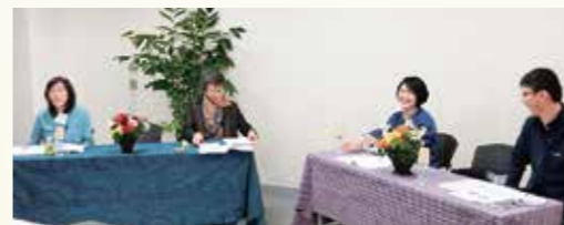
「研究フォーラム2021・withコロナの時代と生命や生活を大切にす経済・社会」パネルディスカッション登壇者の皆さん

参加型システム研究所は、市民社会を強めていくために、市民団体、非営利・協同セクターによる主体的な活動および連携を促進していくことを主な目的として2001年に設立されました。生活クラブ生協・神奈川、福祉クラブ生協、神奈川ワーカーズ・コレクティブ連合会、NPO法人ワーカーズ・コレクティブ協