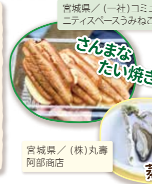
宮城県/(一社)コミュニケーションスペースうみねこ

カンパ金 178,288円 (2022年11月14日時点) ※売上げ金の一部および カンパ金を被災地支援 団体へ送ります