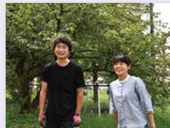
一般社団法人かけはし(横浜市)

エコロジーとフェミニズムを哲学とした農業を展開。化石燃料からの脱却、ごみを出さない地域資源循環型栽培の他、ジェンダー平等を実現し女性一人でも取り組める農業を行う。農業と芸術を融合させた農園は憩いの場にもなっている。