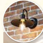
中央レンガ調の柱がポイント 通路は広く、より明るいフロアに