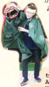
せしモニーでは お祝いの 獅子舞を披露

新メンバーでの運営委員会が発足してから3ヶ月と短期間での準備となりましたが、運営委員・ワーカーズ・組合員が手を携えて様々なイベントに取り組み、リニューアル初日から「のぼりとデポー」を盛り上げることができました。これまで来所して消費材は購入しても活動にはなかなか参加することがなかった組合員が、オープニングイベントでは運営側に回り積極的に参加するようになるなど、新しい