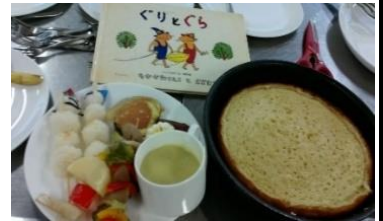
まじよらぼの「ぐりとぐら」 テーマの絵本カフェより