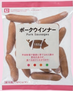
② ポークウインナー (165g) (冷蔵)