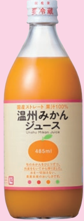
① 温州みかんジュース (485ml)