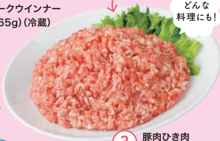
③ 豚肉ひき肉 (240g) (冷蔵)