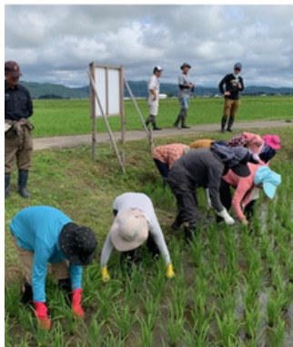
草取り作業の様子

7月ともなれば稲も育ち倒れてしまうため、除草機は使えません。これは心が折れる!!『実際、完全勝利は目指さない』が掟だとか。生産者の「組合員に会えるからこの苦勞もできる」の言葉が胸に刺さりました。また「無農薬・減農薬の目的をよく考えてほしい。健康への影響を心配するなら、通常の基準で問題ない。地球の未来を考えたい、それを組合員と共有したいんだ」とも。明るく果敢にチャレンジを続ける生産者たちに一人の消費者として心底力づけられた2日間でした。(中原コモンズ 鳥海幸恵さん)