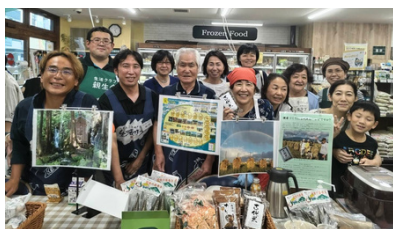
遊佐フェア @のぼりとデポー