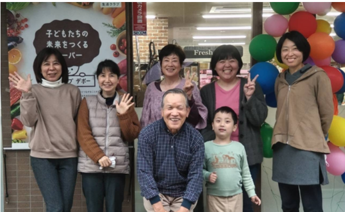
▲のぼりとデポー 店頭にて 運営委員会メンバーと