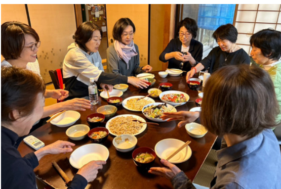
▲あさお西 commons 運営委員会にて試食中