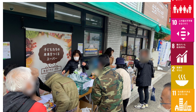
▲たかつデポ フードバンク