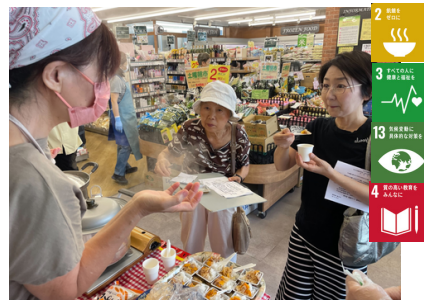
◀宮前平デポ 減災デー パッククッキング試食