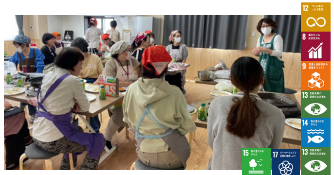
▲あさお東commons 生産者交流会