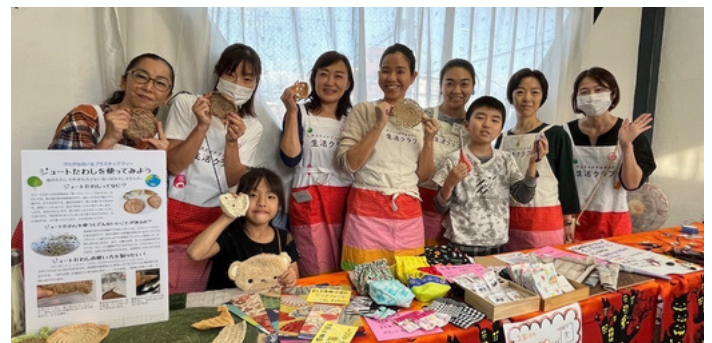
▲かわさき commons 戸手まつりウィーク