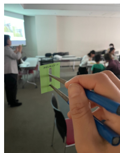
おはし名人カードを使った箸使いの練習にも挑戦

自分たちの望む川崎のまちづくりを考える、平和と生活のつどいは「給食」をテーマに開催しました。