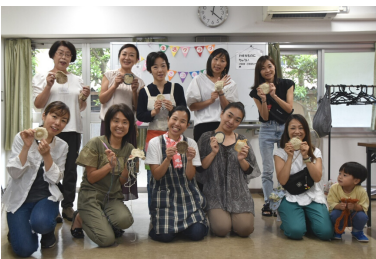
かちさきコモンズあみあみ隊