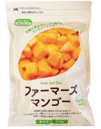
① 冷凍 ファーマーズ カットマンゴー