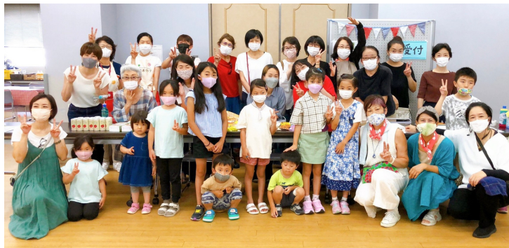
高津コモンズエコ活マルシェ