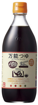
万能つゆ タイハイ(株)

麺類だけでなく、納豆や色々なものに使えて便利！料理が得意ではない私もこれを使えば、煮物や親子丼も簡単にできちゃいます。少し甘めでお気に入り！予約注文して我が家にはかかせません。