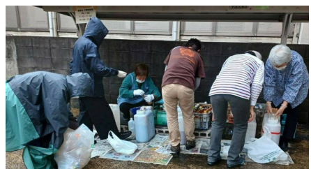
集めた廃食油を詰め替えします。詰め替え隊も募集中！