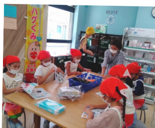
たかつデポー子ども企画