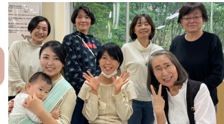
運営委員メンバーで 活動を盛り上げていきます！