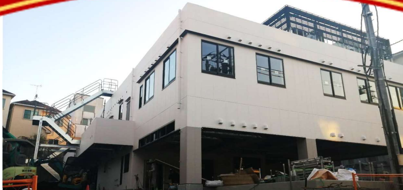
👉 写真は2月初旬のものです。この後着々と完成に向かっていきます。

日本初の生協が行うデイサービスとして1987年に誕生した生活リハビリクラブ麻生の移転とともに、地域の参加型福祉の新拠点として、 るーむら麻生 がオープンします。