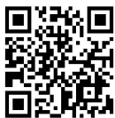
キララ賞の 詳細はこちら

環境活動家である彼女たちから「選ぶ責任」「任せる責任」を再確認するとともに、地元こんなに素敵な若者がいるんだ！と心が熱くなりました。先に生まれてきた大人ができていないことをやっている若者たちの声をしっかり受け止め、「環境活動家がない豊かな地球」とともに作るべく、私にできることを一步一步すすめていこうと思いました。