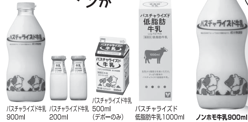
パスチャライズド牛乳 900ml パスチャライズド牛乳 200ml パスチャライズド牛乳 500ml (デポーのみ) パスチャライズド牛乳 低脂肪牛乳 1000ml ノンホモ牛乳900ml

生活クラブのノンホモ牛乳は、従来のパスチャライズド牛乳と同じ質の高い生乳を使い、72℃15秒殺菌で生産されます。ノンホモ牛乳をつくるには、質の高い生乳と技術が求められるため、スーパーなどではほとんど見かけることが出来ない希少な牛乳です。 市場の95%近くは超高温殺菌牛乳 日本では大量生産に向けていて、保存性の良い超高温殺菌牛乳(120℃/130℃で短時間殺菌)が市場に多く出回っています。この殺菌方法では、高い熱を加えることによって有害菌はもとより有用菌まで死滅させてしまいます。