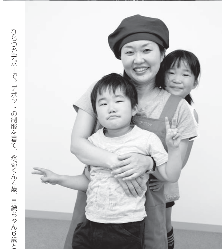
ひらつかデポにて。デポットの制服を着て、永都くん4歳、早織ちゃん6歳と

W.Coは1880年代にフランスで生まれ、欧米で発展しました。日本では、生活クラブ神奈川がデポを運営する担い手として、1982年に日本で第1号のワーカーズ・コレクティブである「人人(にんじん)」をつくり、以降各地に広がり、現在にいたります。