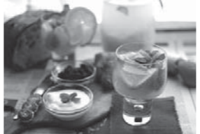
「たまには大人女子」のクッキング・調理例

8/11(祝・木) 13:00～16:30 5,000円/①②③ スイカ酵母の冷たいパンチを飲みつつクッキング。カラフル野菜のフォカッチャ・燻製卵トッピングピザ・グルテンフリーのビスコッティなどを予定。