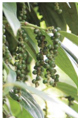
ブラックペッパーの実

毎週のように開催している交流会では、「スパイスの使い方が分からない」という組合員の声に応え、試食やレシピ提案を行なっています。スパイスを使うことで、実は簡単に風味豊かなおいしい料理が作れるというサプライズを、みなさんに感じてもらう、使う機会を増やしてもらえたら嬉しいです。