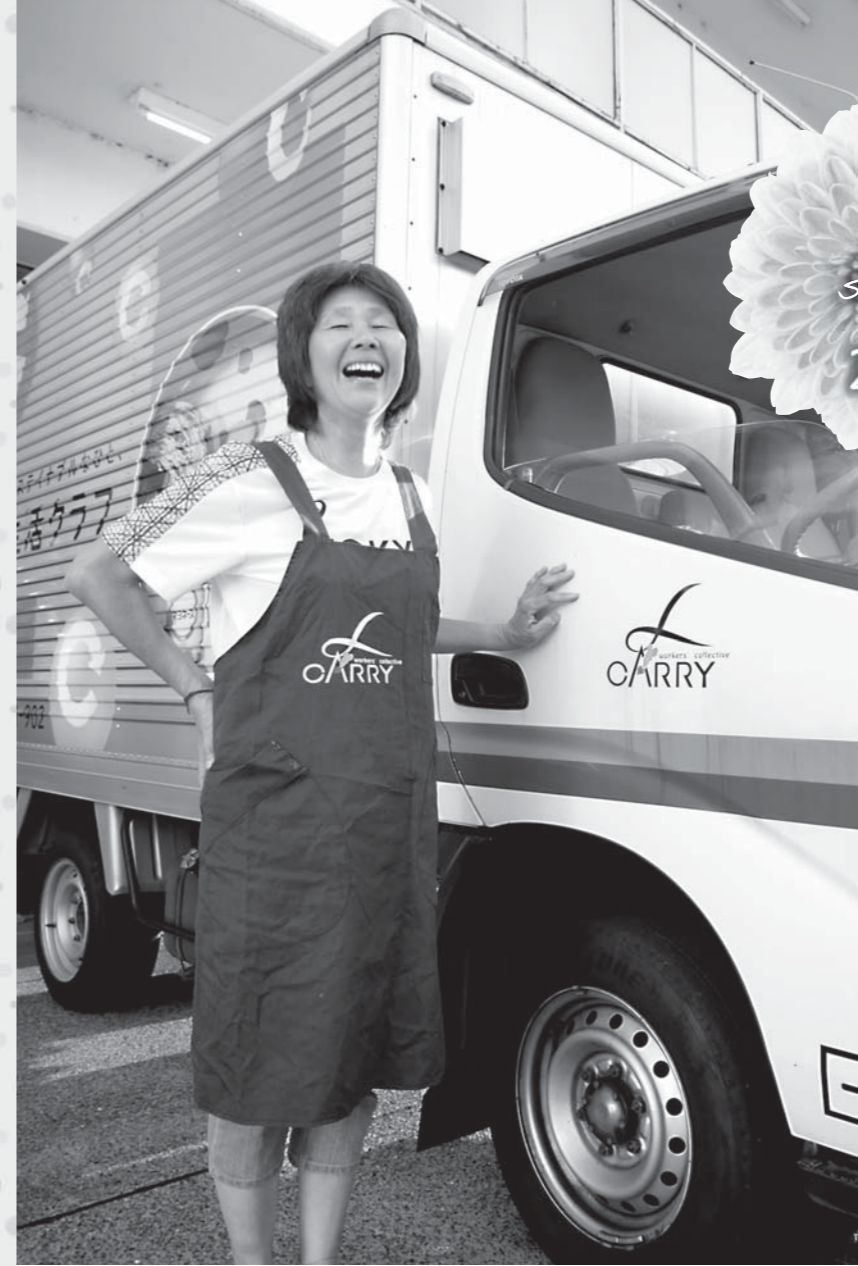
配達用のトラック前にて、キャリーの制服エプロンを身につけて