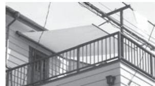
ロールスクリーンタイプ (定価で税抜き3万円前後)

オルタスクエアでは日よけ取付工事も行っています!夏の暑さの原因は、窓から入る日差しだけではなくありません。熱くなったベランダ・壁・屋根の熱が室内に放射されるため、夜になっても暑さが続くのです。「日よけ」が有効な対策です。アームで支えるタイプ、ロールスクリーンタイプなど色々あります。見積もりのご相談はお気軽に。