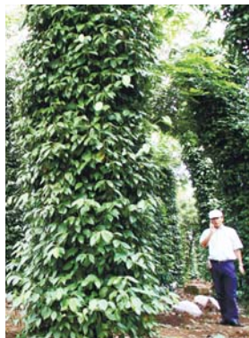
ブラックペッパーの木

スパイスを作る工程は決して複雑ではありませんが、生活クラブが求める情報開示や、さまざまな要望に対応していくには、小回りのきく私たちがピットリだったのだと思います。