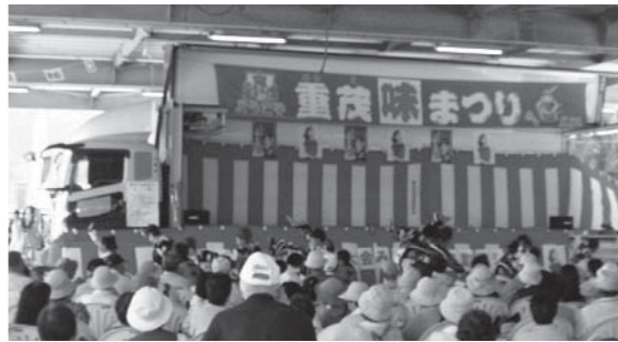
トラックを活用したメインステージ

「肉厚わかめ」等の生産者である重茂漁協主催の味まつりに3人が参加し、加工品販売の支援を行いました。前日の交流会では、地元の方や生活クラブ岩手の組合員と交流することができました。参加・支援を通して、重茂の復興状況を実感する事ができました。