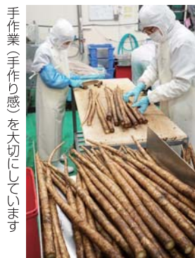
手作業(手作り感)を大切にしています

私たちは3年前から近隣の農家に土地を借りて畑を始め、一部ですが消費材の原料にもなっています。組合員と畑での交流も行っています。これからは収穫した野菜を使って子どもたちと一緒に調理をするなど、食育を意識したイベントも進めたいですね。