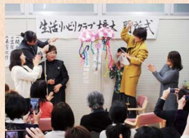
1月25日(日) 開所式でのくす玉割りの様子