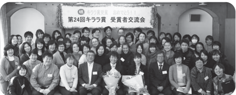
お二人の受賞を皆でお祝いしました！