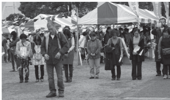
参加者による黙祷（開会式）

雨天での開催にも関わらずおおぜいの来場があり、出展者と来場者、出展者同士といった参加者全体で交流ができ、多くの人と震災復興への想いを共有することができました。