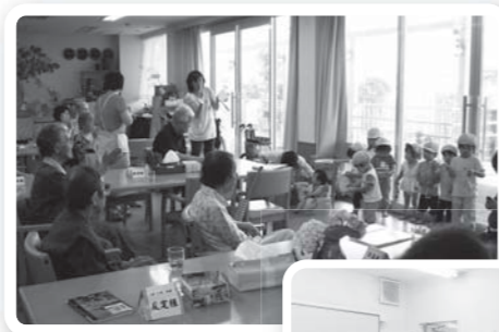
利用者も楽しみに している保育園児 との交流