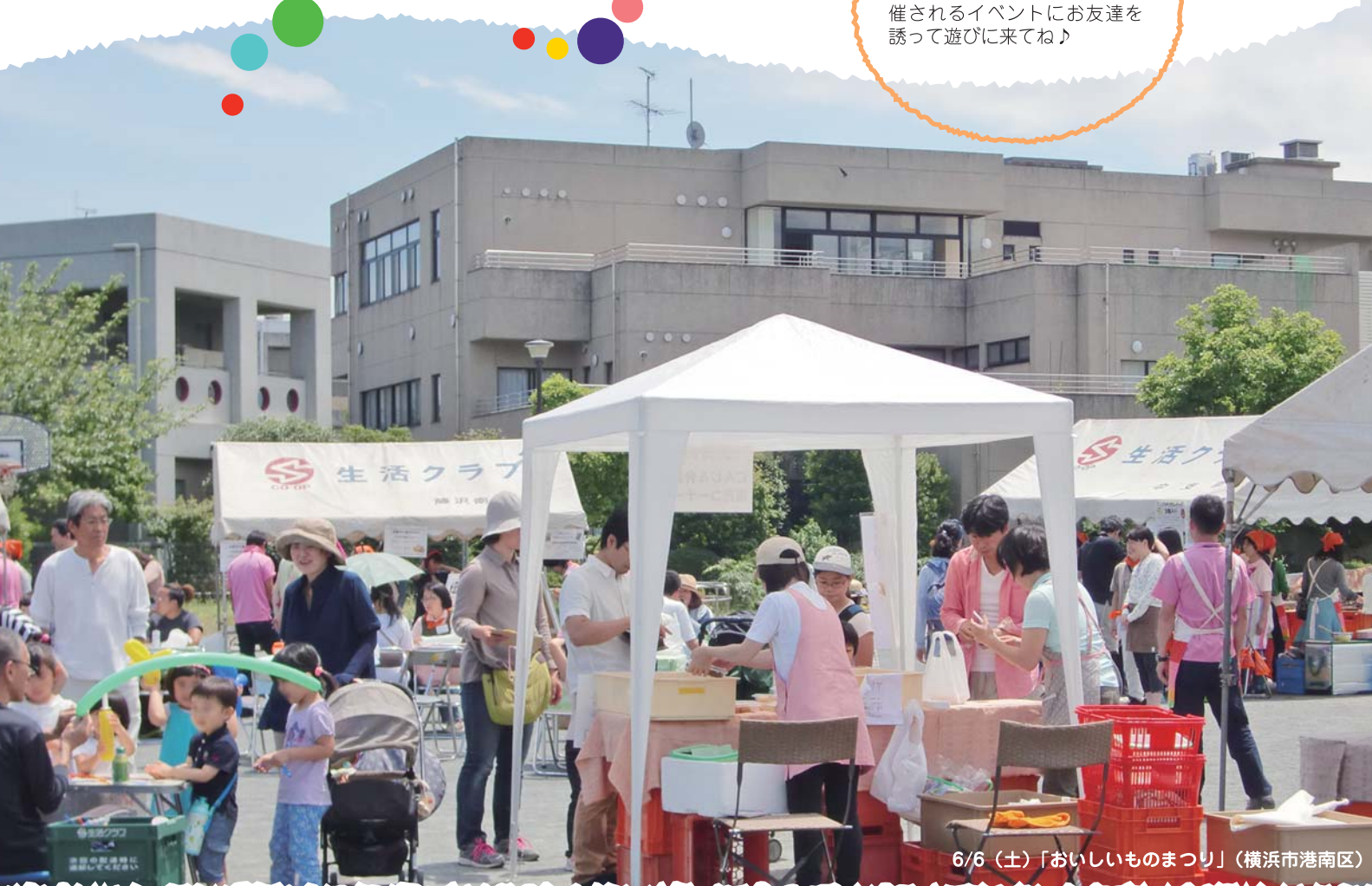
6/6 (土)「おいしいものまつり」(横浜市港南区)

イベントで、生活クラブをア ピール!この秋、各地域で開 催されるイベントにお友達を 誘って遊びに来てね♪