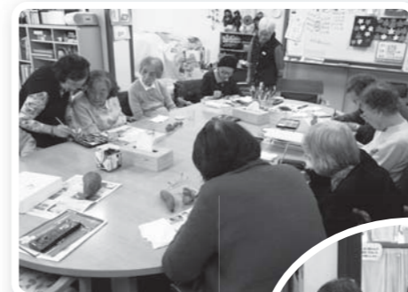
絵手紙に熱心に 取り組む利用者の皆さん

他にも、趣味を活かしながら活動しているボランティアが数名いますが、午後のアクティビティにさまざまな形で参加され、経験を活かす場、発表の場にもなっています。