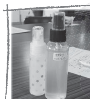
好みの香りを調合した、爽やかなアロマスプレー