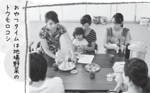
おやつタイムは地場野菜のトウモロコシ

※衣食住にわたるさまざまな化学物質の問題点を調査し、情報発信や相談などの活動を行っている団体