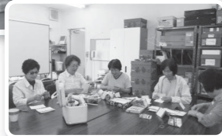
デイサービスに必要な 準備をしてくれる ボランティアグルー プ「ひだまり」