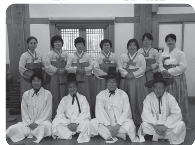
韓国の伝統衣装を着て茶礼や挨拶の仕方を学びました(7月)