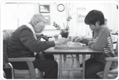
子どもボランティアが将棋の対戦中。