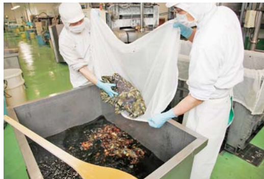
「しば漬」製造風景(塩抜きした原材料を漬けています)

できます。噛む力が弱くなった方のために、ペースト状にして成形した漬物などにも挑戦しています。組合員の皆さんの要望をきちんと受け止めて、それを実現していける会社として、これからも頑張っていきたいです。