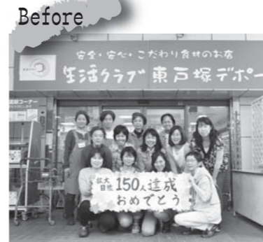
みんなの力で目標達成しました!(リニューアル前のデポーで撮影)