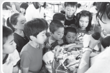
みんなで作ったエコカレー♪保温調理した鍋を取り出すところ

締切り 7/19(日) メール kawasaki.seikatsu.club@gmail.com FAX 044-852-0680