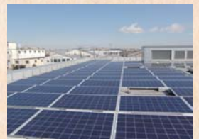
あやせ総合センター 太陽光パネル

*1994年に生活クラブ神奈川設立20周年記念事業として組合員7万人のカンパにより設立された社会福祉法人いきいき福祉会が、設立から15年目を迎えた2009年、それらの事業の集大成として開設した特別養護老人ホーム