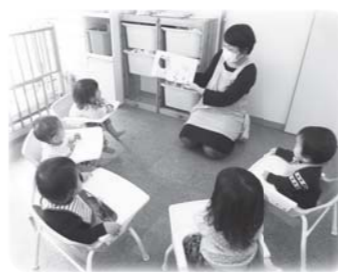
保育園での読み聞かせの様子